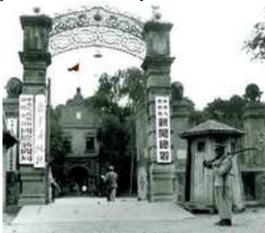
1950 жылғы Шин-һуа қақпасы

- азаттық соғысы қарсаңында шин-һуа агенттігі өте тез қарқынмен дамады. Соған сәйкес 1946 жылы майда бас органын қайта құрды. Сонымен бір уақытта, әр соғыс майдандарына әскери тілші және тілшілер үйірмесін жіберді. Тіпті алдыңғы шептегі әскери болімшеде де тілшілер жасағын құрып, дер кезінде ақпарат иаратып отырды. 1947 жылы науырызды орталық партия органы иэн әннан шегінді, агенттіктің санаулы журналистері мау зы дун, жоу ін лэй қатарлы басшылырмен бірге жия бейға ілгерлесе, қалғандары һы би өлкесінде табандылықпен жұсыс істеді. 20 ғасырдың 50 жылдарының орта шенірде, шин-һуа мемлекеттік беделді ақпарат агенттігі болумен бір уақытта, әлемдік деңгейдегі ақпарат агенттігі болуғы атсалыма бастады.